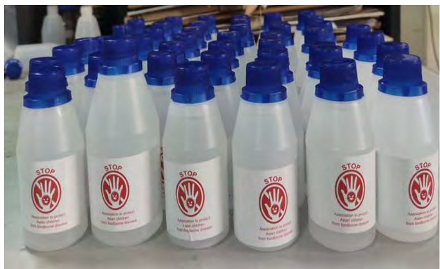
Masks and disinfectants with the NPO logo created by Bangladeshi volunteers