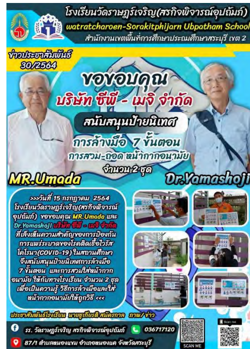
A poster expressing gratitude to the NPO