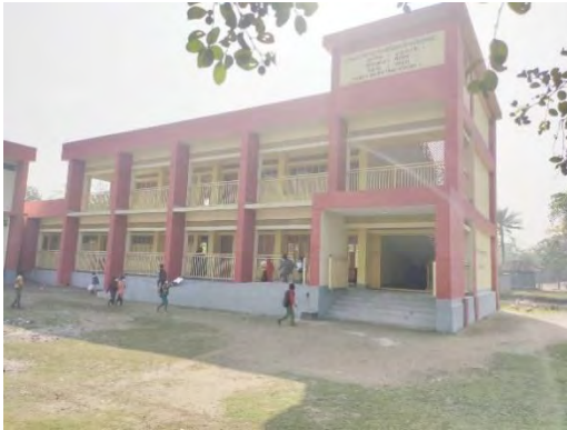
The school building