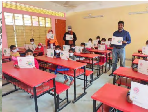
A clean classroom with a red desk (There is a fan on the ceiling)