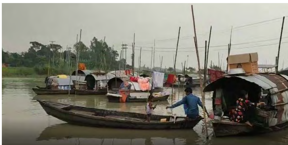
The ships where the water dwellers live.