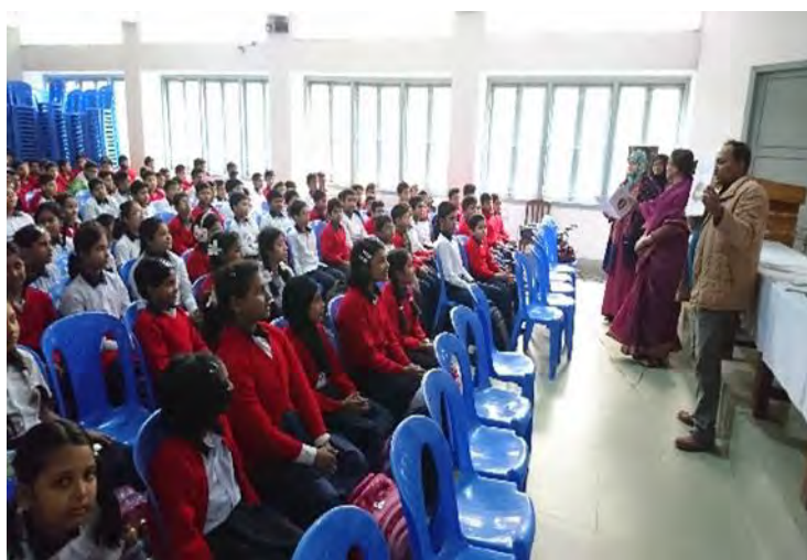
Explanation at an elementary school in Dhaka, the capital of Bangladesh (February)