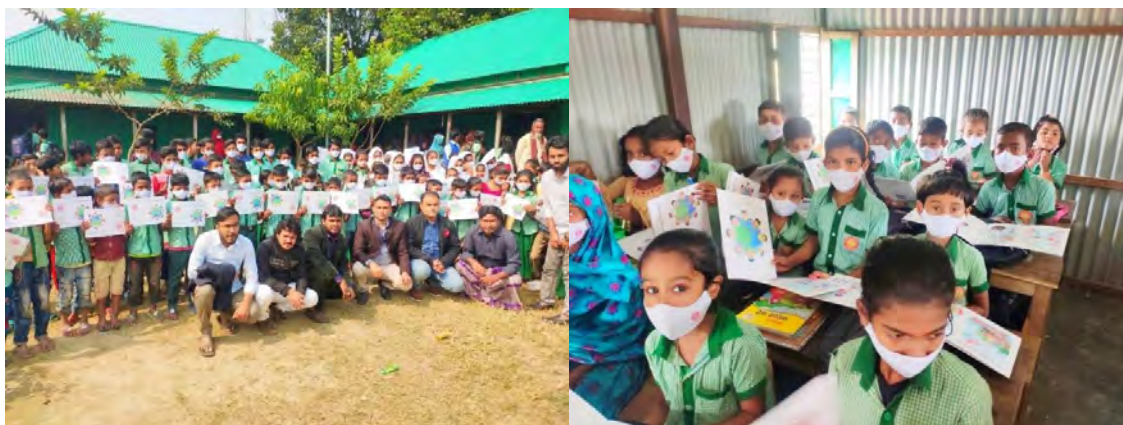
Picture book presentation ceremony