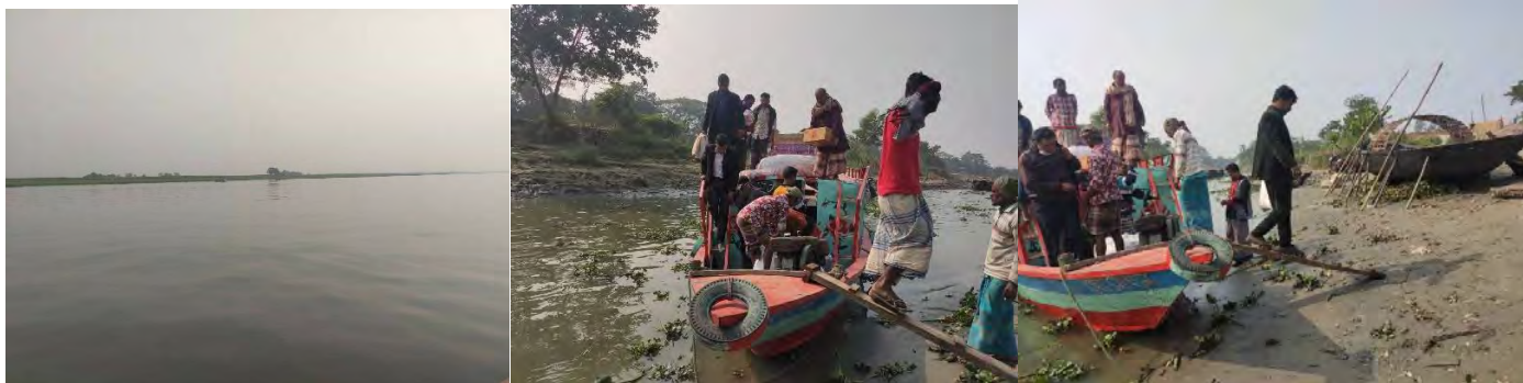
Travel to the destination by boat across Bangladesh's largest river, Megna