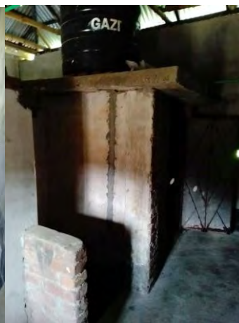
Toilet (There is a water tank above the toilet)