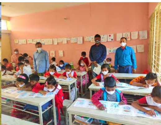
Reading at class room