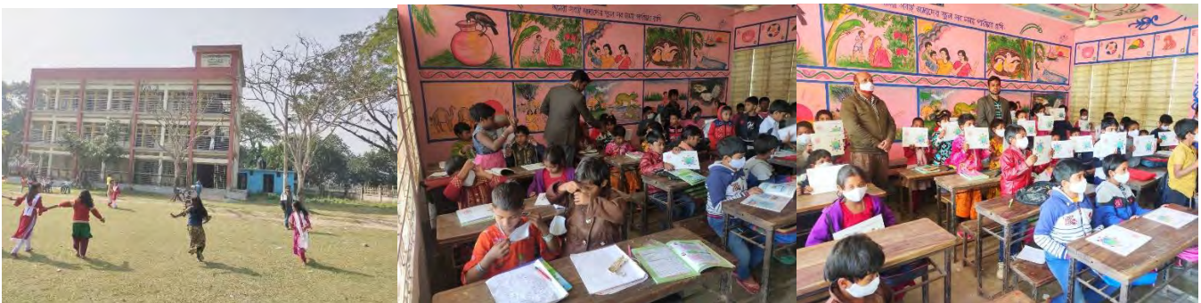
A panoramic view of the school