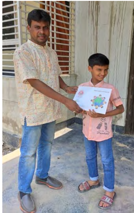
Distribution of picture books by door-to-door visit (Bangladesh)