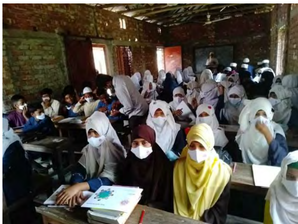
Class room (There is a fan on ceiling)