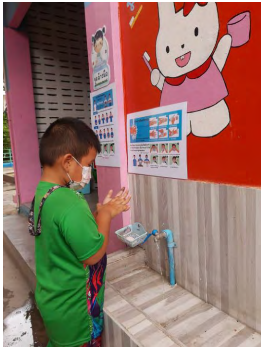
Children washing their hands while looking at the poster