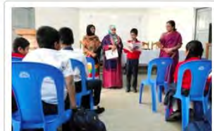
バングラデシュの小学校で絵本を読む子ども 拡大

ところが、２０年にコロナの感染が拡大。渡航した上での活動は滞ったが、日本から絵本を送り、現地の非政府組織（ＮＧＯ）のスタッフらが読み聞かせを代行。ミャンマーの僧院では、孤児たちが手洗いに励むようになり、感染防止に効果を発揮したという。２１年２月には軍事クーデターが発生。活動は一時滞ったが、１０月からは最大都市ヤンゴンで絵本を印刷し、クーデターの影響で失業中の日本語ガイドが小学校などに絵本のほか、マスクや消毒液を配った。