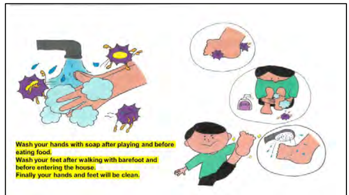
Cover of hygiene picture book for infants (English version)