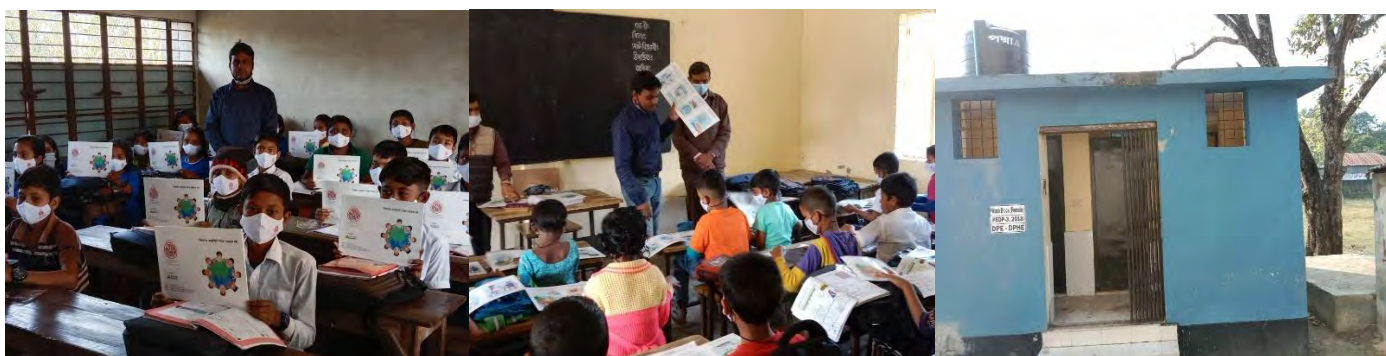
Picture book presentation ceremony