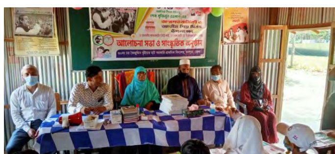
Picture book presentation ceremony