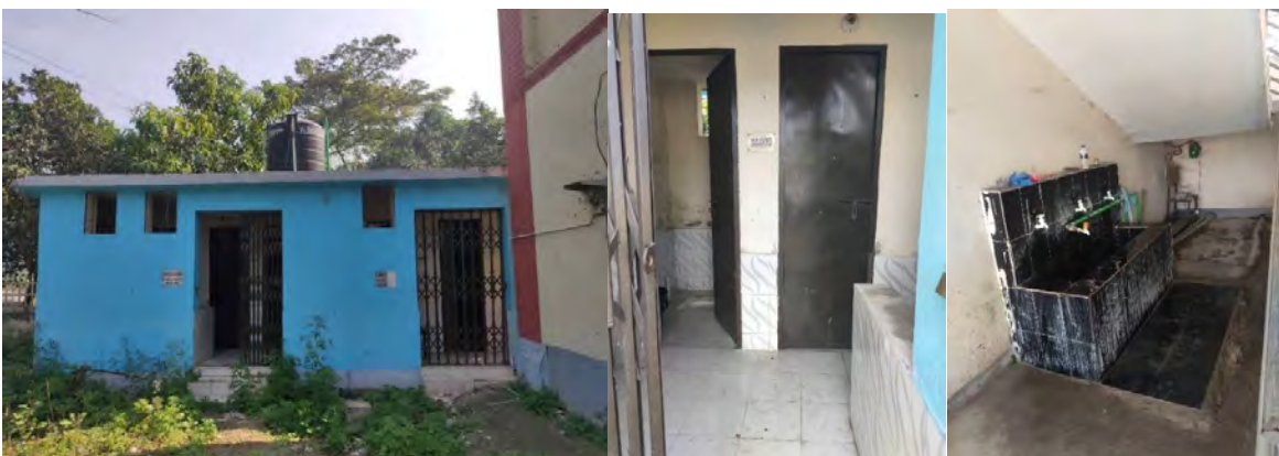
The appearance of the toilet