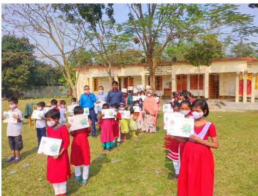
Picture book presentation ceremony