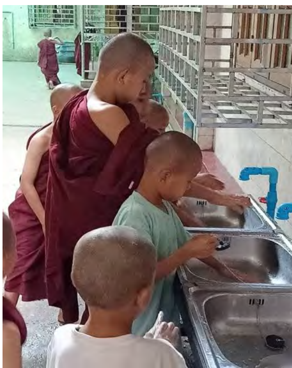
Story-telling and hand-washing practice at Ku mar lar ra mar monastery in Myanmar (March)